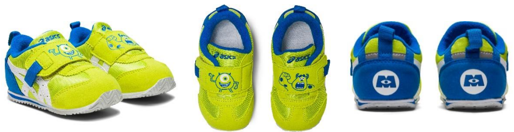
IDAHO BABY / MI ライム×ホワイト