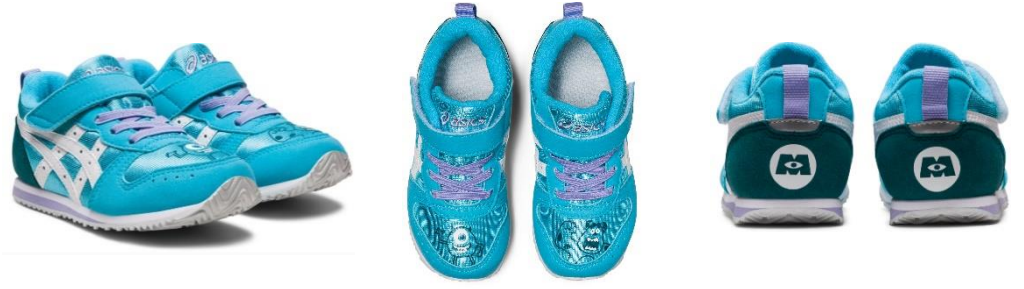
IDAHO MINI / MI アクア×ホワイト