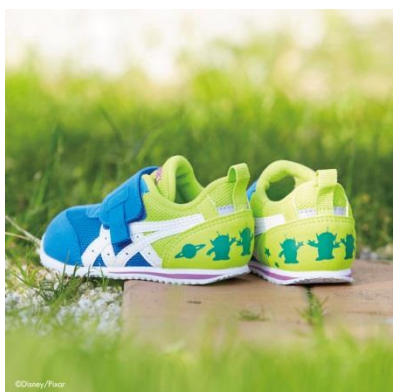
IDAHO TS4 BABY (ブルー)