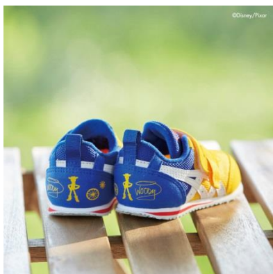
IDAHO TS4 BABY (イエロー)