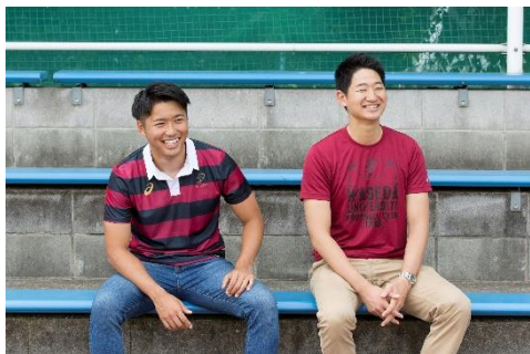
早稲田ラグビーレプリカジャージ(左)