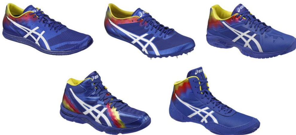
左上：マラソンシューズ 中央上：陸上短距離用スパイクシューズ 右上：テニスシューズ 左下：バレーボールシューズ 右下：レスリングシューズ

本商品は、より高いレベルに向かって日々励むアスリートの思いを表現したもので、競技の枠にとらわれず、同じ思いを持った人々を「つなぐ」といった意味を込めて企画しました。