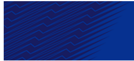
「CONNECT」をイメージしたグラフィック

今回展開する「FLAMEシリーズ」は、コンセプトを「CONNECT（コネクト：つなぐの意味）」としています。「世界をつなぐ、人々をつなぐ、リオから東京へをつなぐ」「心と体をつなぐ、過去と未来をつなぐ」といった意味を込めています。この「つなぐ」という言葉や動作、振る舞いを連想するイメージをグラフィック化し、アッパー（甲被）